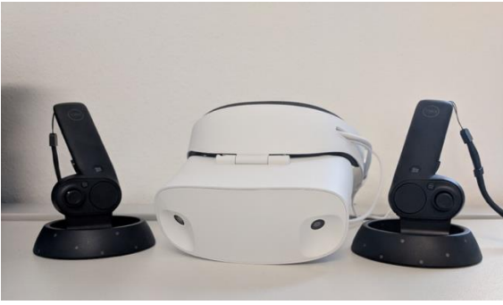
Abbildung 2: Beispiel eines Head Mounted Device zur Darstellung und Interaktion in einer Virtual Reality Szene (Dell Visor Mixed Reality Brille)

Pflegeaufgaben und Kommunikation, sowie der Aus-, Weiter- und Fortbildung mit neuen sogenannten Head Mounted Devices.