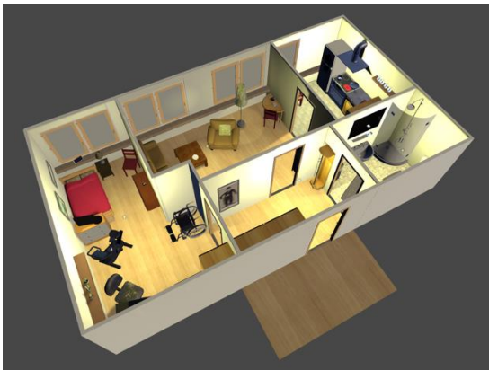
Abbildung 3: Interaktives Modell des Smart Home in Virtual Reality

Reallabore, wie z.B. das bestehende Smart Home Labor (IDEAAL 2 ) zur Demonstration und Evaluierung von neuen Innovationen in der Pflege sind jedoch nicht überall und zur jeder Zeit verfügbar, insbesondere nicht für Pflegeschulen. Virtual Reality ermöglicht es jedoch auf immersive Weise das Erleben eines Smart Homes an andere Ort zu bringen und für die Ausbildung zugreifbar zu machen. In PIZ wurde daher das IDEAAL Reallabor in einer digitalen, dreidimensionalen VR Szene nachempfunden. Der Besuch und die Interaktion mit den Geräten in dieser digitalen Wohnung erfolgt über eine Virtual Reality. So können technische Neuerungen in einer häuslichen Umgebung im Rahmen der Aus- und Weiterbildung demonstriert und evaluiert werden, ohne die aufwändige Infrastruktur eines Smart Home Labors zu besitzen bzw. direkt vor Ort sein zu müssen.